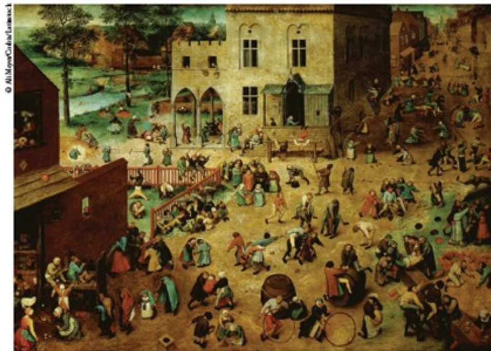
Brincadeiras de criança , de 1560: o quadro de Pieter Bruegel (1525-1569) apresenta várias brincadeiras e jogos típicos da época, muitos ainda existentes na atualidade (óleo sobre tela, 118 cm x 161 cm). Acervo Kunsthistorisches Museum, Viena.

a) Embora o quadro se chame Brincadeiras de criança , são apenas crianças que estão brincando?