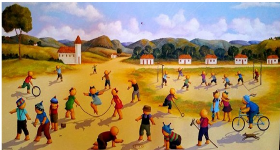
Série Memórias de infância, 2016. Ricardo Ferrari

Identifique quais brincadeiras e jogos estão retratados na imagem?