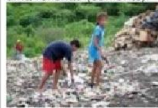
Famílias vivendo em lixões.

2º Observe as fotos e faça uma reflexão (comente).