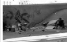
Moradores de rua.

3º Encontre no diagrama as palavras em destaque no texto.